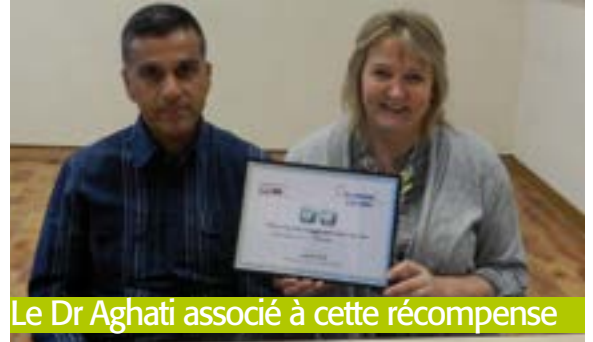
Le Dr Aghati associé à cette récompense