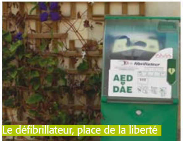
Le défibrillateur, place de la liberté