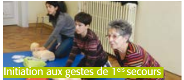
Initiation aux gestes de 1 ers secours